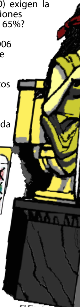
El Figón. La Jornada 06-09-0

Proyecto: “Contexto, Conflictividad Social y Derechos Humanos en Chiapas 2007” FOLLETO POPULAR No. 7, Agosto de 2007